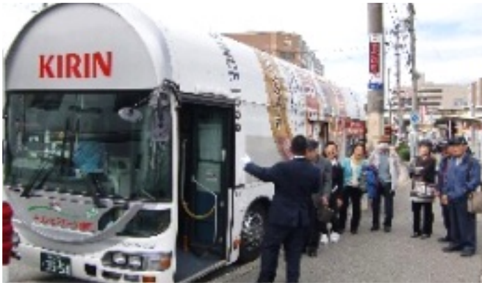
三田駅からは、ビールのバスに乗り換えて

11月5日、長田区会はキリンビール工場（北区）見学ツアーを実施しました。参加者8人は、三宮から神戸バスに乗車。三田までの1時間は、「遠いな」と思っていたのですが、おしゃべりしていたらあっという間に到着です。久しぶりに、遠足気分を味わいました。