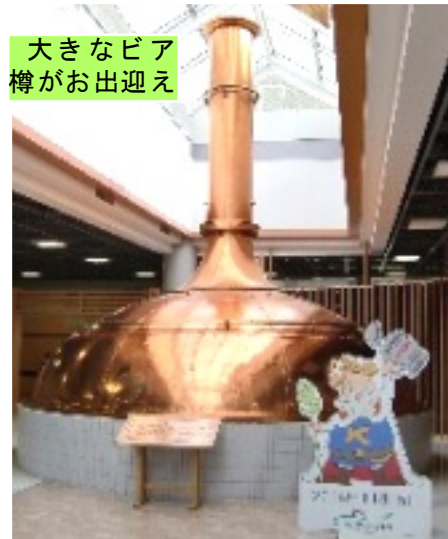
大きなビア樽がお出迎え