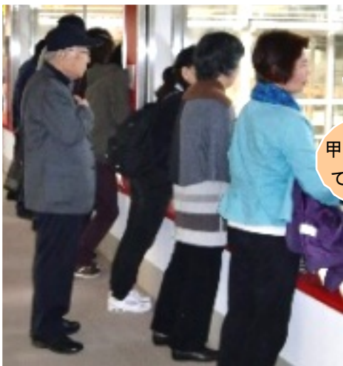
工場を上から見下ろす