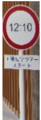
工場見学スタートわくわくします